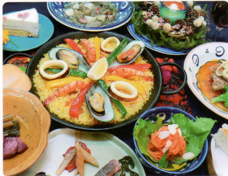
料理▲スペイン料理店にいたオーナーがお作ります。(写真は一例)