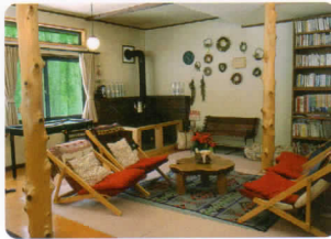
ロビー▲夏はそよ風、冬は暖炉の火がお出迎えます。