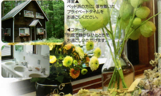
ロッジ全景▲ 木々に囲まれた中で小鳥の声で目覚める。心ゆくまでお過ごしください。